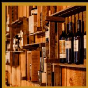
grote collectie wijnen