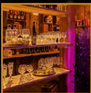
assortiment aan wijn-, water en cocktailglazen