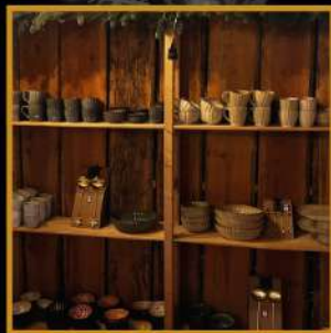
koffie- en theemokken