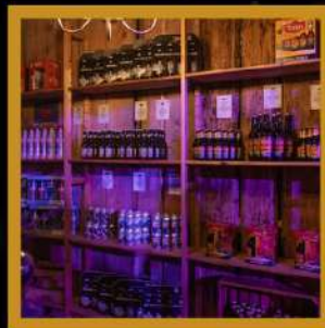
sokken, mutsen, wanten & sjaals