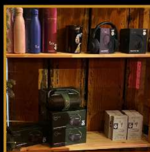
speakers, draadloze oordopjes, koptelefoons