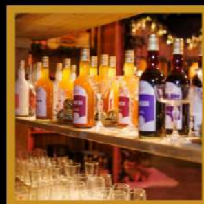
likeuren, whisky's en cocktails