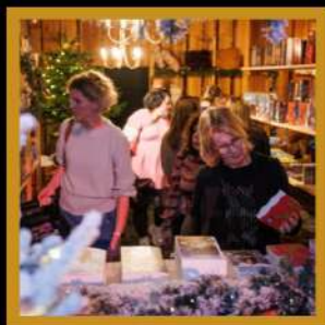
boeken en scheurkalenders