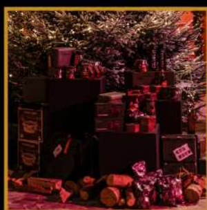
koelboxen, waterflessen, hybride barbecue