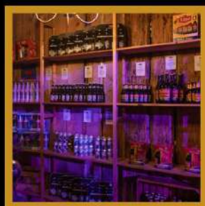
(speciaal)bieren en geschenkverpakkingen