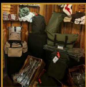
(waterdichte) reis- en rugtassen