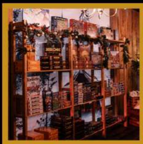
puzzels en spellen